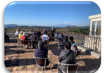
中伊豆ワイナリーテラスにて