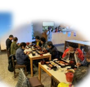
小室山レストハウスにて