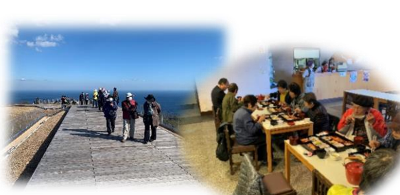
小室山頂上遊歩道