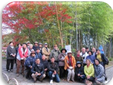
修善寺温泉竹林の小径