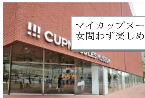
マイカップヌードルが作れる！老若男女問わず楽しめる体験型ミュージアム

※ 希望する方は、下記の受付書に記入して互助組合小笠支部事務局へ提出して下さい。 〒436-0017 掛川市杉谷734の4 電話：0537-24-6385 FAX：0537-24-4071 E-Mail：ogasa@sizu-kyogo.com