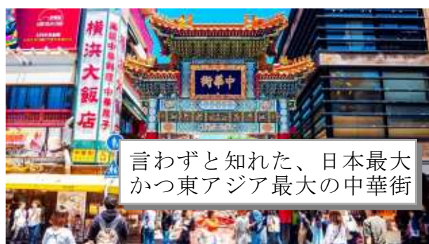
言わずと知れた、日本最大かつ東アジア最大の中華街