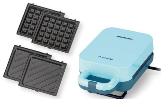
B07 ホットサンド &ワッフルメーカー