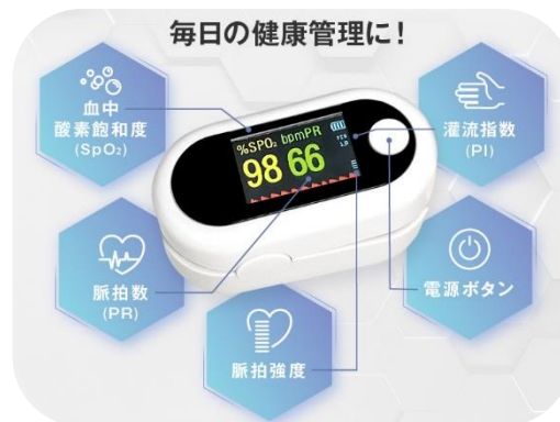
B13 ヘル斯巴ロメーター