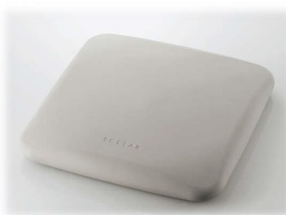
C03 スクエア型バランスクッション