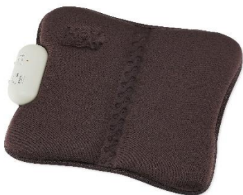
B06 ホットシート マッサージャー