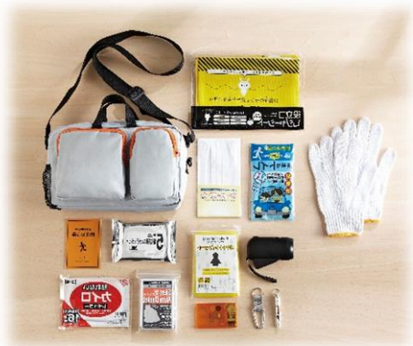
B11 エマージェンシーセット