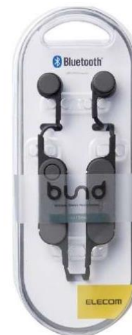
C04 bluetooth ヘッドホン