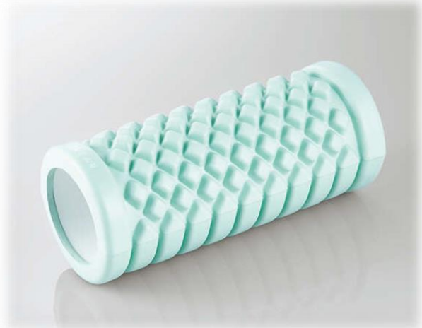
C01 回しやすいフォームローラー/ソフト

※C 運動器具は〈グループ1〉〈グループ2〉から、それぞれ一つご希望の物品をお選びください。