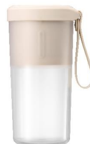
B08 コードレス マイボトルブレンダー