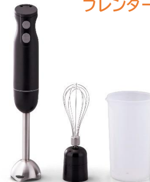
B10 ハンディー ブレンダー