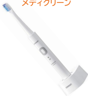
B03 音波式電動歯ブラシ メディクリーン