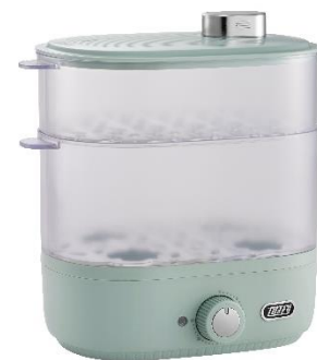
B09 コンパクト フードスチーマー