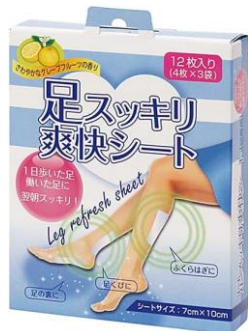
B16 メディキュット(Lサイズ) +足スッキリ爽快シート