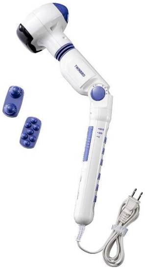
B18 ホットマッサージャー +温泡 ONPO とろり炭酸湯