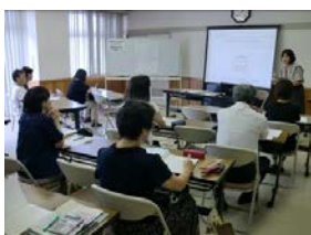
療養費給付説明会