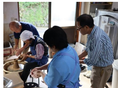
R1.10.27 陶芸教室 耕心窯にて