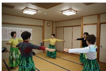
ラジオ体操とフラサークルの会