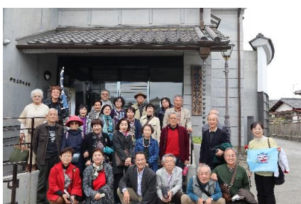
R1.11.7.8 互助ツアー 伊能忠敬記念館