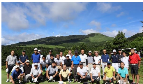
R1.8.6 ゴルフ大会 稲取ゴルフクラブ