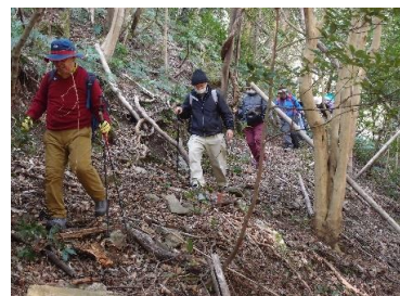
賀茂の古道を歩く会