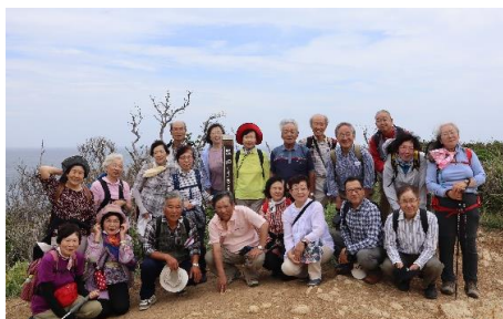
R1.5.28 伊豆西南自然散策