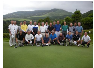
H30.8.7 ゴルフ大会 稲取ゴルフクラブ