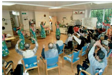
ラジオ体操とフラサークルの会