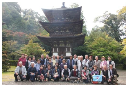
H30.10.23.24 互助ツアー 西明寺にて