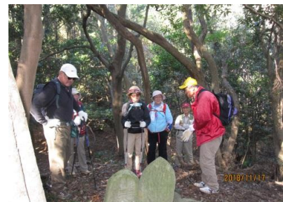
賀茂の古道を歩く会