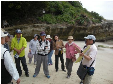
H30.5.17 ブラタモリ風下田地区ジオ散策

賀茂支部のモットーは、 「行ける時、行ける体に感謝して、明るく楽しく元気よく」です。 支部事業、趣味・同好会の活動を紹介します!!