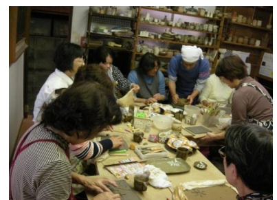
H30.10.28 陶芸教室 耕心窯にて