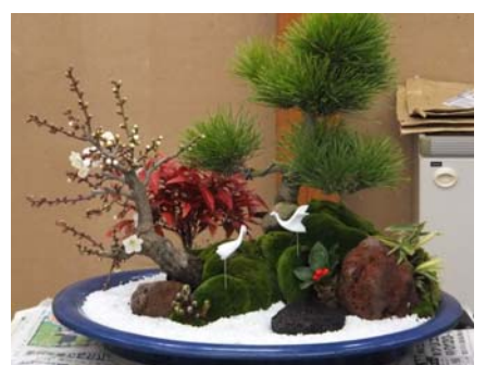
正月・洋風寄せ植え教室