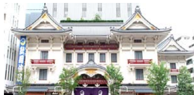
歌舞伎鑑賞 (歌舞伎座)