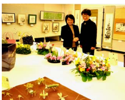
退職部作品展「浜松市教育会館にて」