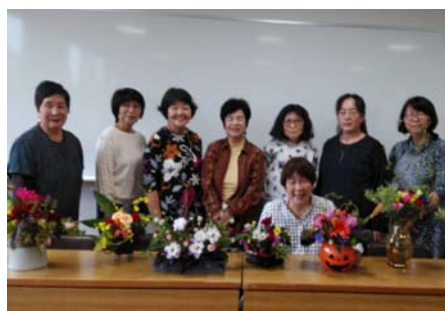
花づくし（フラワーアレンジメント）