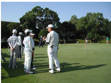
ゴルフ大会「ザ・フォレストCC」