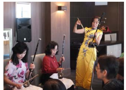
音楽とランチを楽しむ会「クラウンパレス」