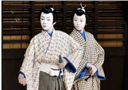
歌舞伎鑑賞「銀座 歌舞伎座」