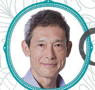
鶴見辰吾 フック船長