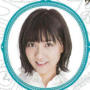
宮澤佐江 タイガー・リリー